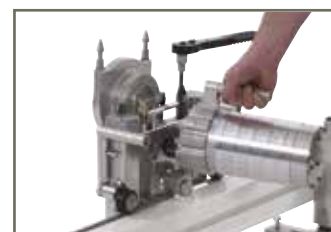
Avtagbar HF motor