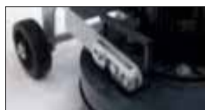
Dismountable for transport