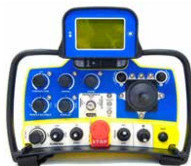
Fjernkontroll med autopilot teknologi

EXP 999 er markedets sterkeste slipemaskin med 6 roterende hoder. Takket være kombinasjonen av størrelsen på slipehodet med 6 kontra roterende slipehoder og et elektrisk trykkstyringssystem, garanterer EXP 999 den høyeste kvalitet av flatthet og polerte overflater. Dette takket være en perfekt balanse på maskinen. Denne maskinen er det ideelle valget for sliping og polering av store områder. Fjernkontrollen og autopilot systemet forenkler arbeidet og øker produksjonen. Arbeidet blir også mer effektivt ettersom støvsugeren kan tømmes under produksjonen og de elektriske kablene kan håndteres. Alt dette mens slipemaskinen fortsetter å fungere alene takket være den eksklusive AUTOPILOT-teknologien.