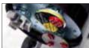
Multi purpose use