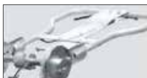
With integrated water dosing