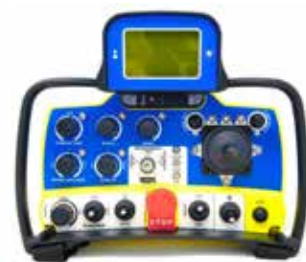
Fjernkontroll med autopilot teknologi

EXP 1000 er markedets sterkeste slipemaskin med 6 roterende hoder. Takket være kombinasjonen av størrelsen på slipehodet med 6 kontra roterende slipehoder og et elektrisk trykkstyringssystem, garanterer EXP1000 den høyeste kvalitet av flathet og polerte overflater. Dette takket være en perfekt balanse på maskinen. Denne maskinen er det ideelle valget for sliping og polering av store områder. Fjernkontrollen og autopilot systemet forenkler arbeidet og øker produksjonen. Arbeidet blir også mer effektivt ettersom støvsugeren kan tømmes under produksjonen og de elektriske kablene kan håndteres. Alt dette mens slipemaskinen fortsetter å fungere alene takket være den eksklusive AUTOPILOT-teknologien.