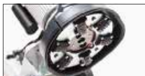
With scarifier tool