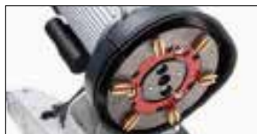
One diamond system for all floor grinders