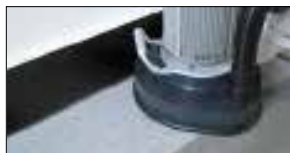
Sliper inntil veggen