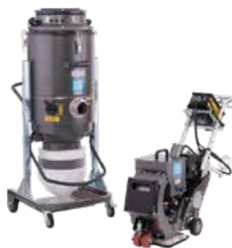
Til blastring trenger man også en foravskiller og støvsuger.