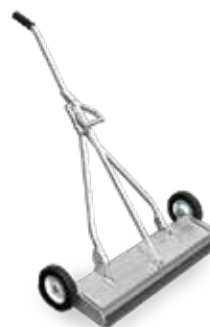
Denne henter opp metall- rester raskt og enkelt.