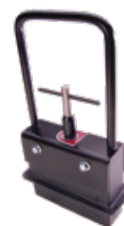
Magnetisk oppsamler for stålkuler.